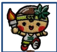
デザイン1 とちまるくん 国体Ver.