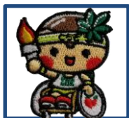
デザイン2 とちまるくん 大会Ver.