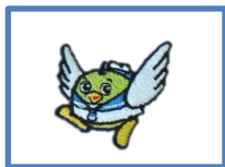
No1: 胸 トリピー 刺繍